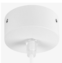
Suspensión ajustable (1,5m)