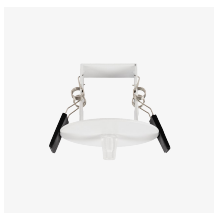
Base empotrar blanco Ref. 1.2020.8100