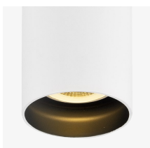
Cuerpo blanco y reflector negro