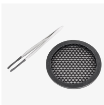
HONEYCOMB + PLIERS BOGOTA Ref. 1.2020.8101