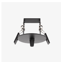
Base empotrar negro Ref. 1.2020.8200