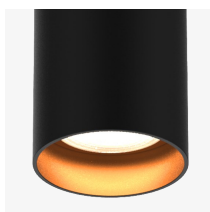
Cuerpo negro y reflector oro